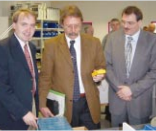
Mit Hessens Finanzminister bei KoCoS.

unsere Stadt nahezu die niedrigste Arbeitslosenquote. Wir wollen hiesige Betriebe stärken, uns für die heimische Wirtschaft einsetzen sowie neue Unternehmen ansiedeln.