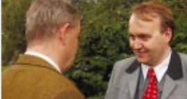
Mit den Bürgern im engen Kontakt, unsere Stärke - für unsere Heimat.