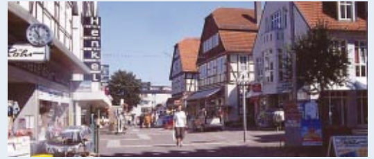
Unsere schöne Stadt muss bürgerfreundlich und lebendig bleiben.

Für die städtische Entwicklung hat die CDU in den vergangenen Jahren sehr viel geleistet: die Ansiedlung neuer Geschäfte, die Sicherung und Stärkung des Einzelhandels, die höchste Zentralitätskennziffer in Korbachs Geschichte. Wir wollen weiterhin die Innenstadt stärken und das besondere „Korbacher Einkaufserlebnis“ ermöglichen. Die „Goldspur“ muss als verbindende Klammer zwischen Innenstadt und Altstadt ausgebaut werden. Korbach muss attraktive Kreisstadt und Standort zahlreicher Schulen, Behörden und Dienstleistungen bleiben.